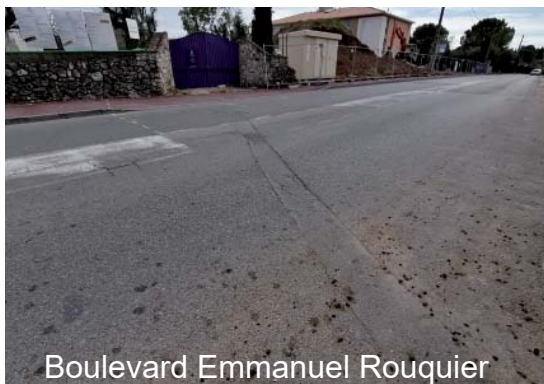
Boulevard Emmanuel Rouquier