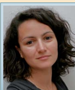
Avocate Conseillère Municipale de Grasse

En d'autres termes, si les constructions envisagées sur le terrain ex Fiat n'aboutissaient pas, la participation de ce propriétaire ne serait plus exigible.