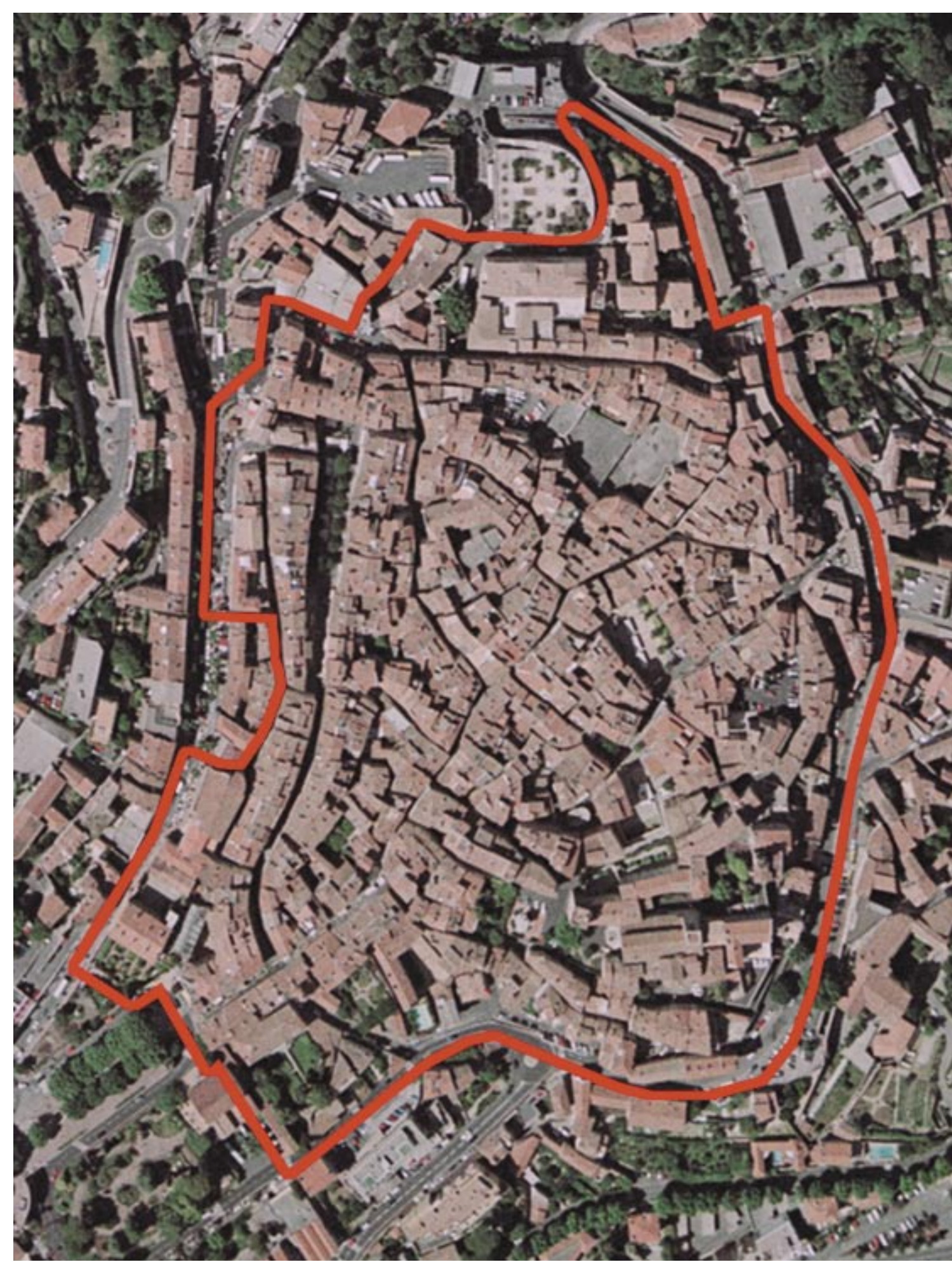
Photographie aérienne : périmètre du Secteur Sauvegardé de Grasse